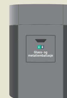
Nedkast for glass- og metallemballasje