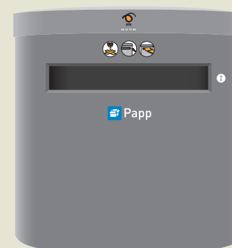
Nedkast for papp