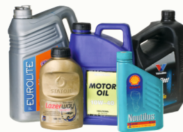
Olje og oljefiltre