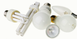
Lyspærer og lysrør