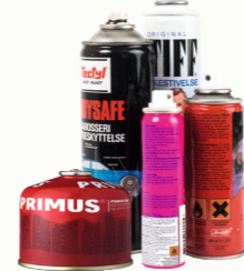
Gass- og spraybokser