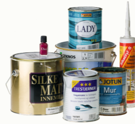
Maling, lim og lakk